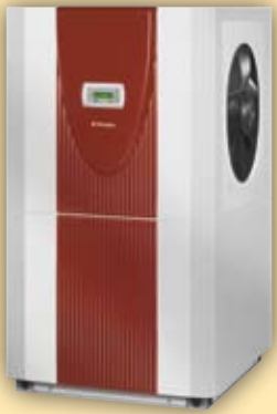
Luft/Wasser-Wärmepumpe für Innenaufstellung