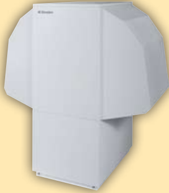
Luft/Wasser-Wärmepumpe für Außenaufstellung