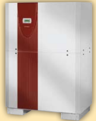
Sole/Wasser-Wärmepumpe für Innenaufstellung

Für ein Wohlfühlklima wird im gut gedämmten Neubau neben einer effektiven Wärmepumpen-Heizungsanlage auch die Gebäudekühlung immer wichtiger. Solare Wärmegewinne, innere Wärmelasten und die Klimaerwärmung führen zu steigendem Kühlbedarf. Dimplex bietet für alle Wärmequellen ein innovatives Konzept, um das wassergeführte Heizsystem auch zum Kühlen einzusetzen.